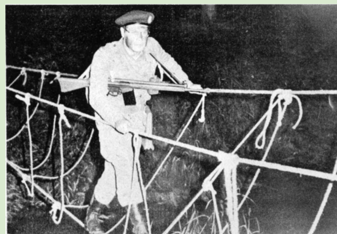
Schwieriger als es aussieht ist das Überqueren der Dschungelbrücke.