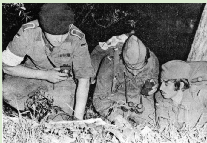
Nach dem Überqueren des Altrheines mußten sich die Gruppen zuerst wieder orientieren.