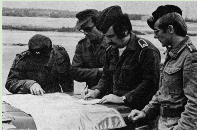
Keine Verständigungsschwierigkeit: Karte ist Karte!

Alle waren sich nach diesem Wochenende einig, daß dies ein weiterer Meilenstein für die gemeinsame Arbeit gewesen ist.